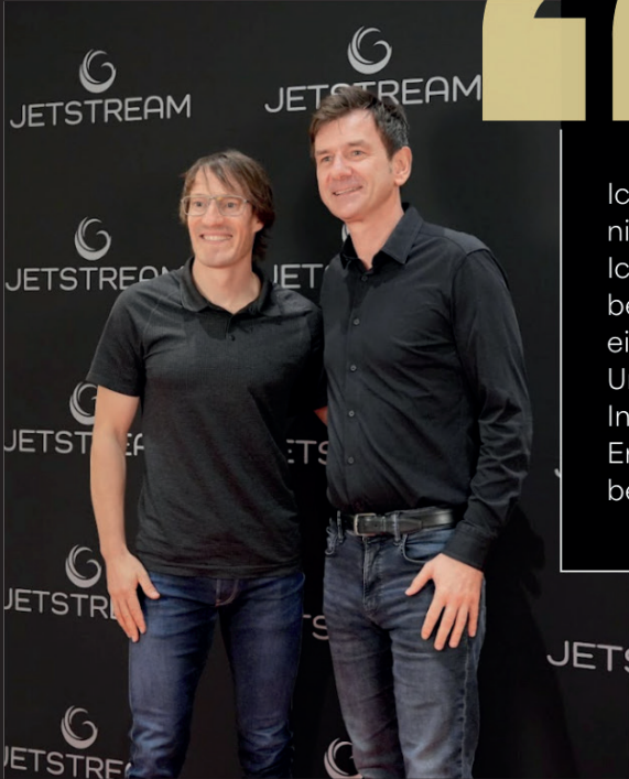
Sebastian Kienle (l.) und Adam Schneider (r.)